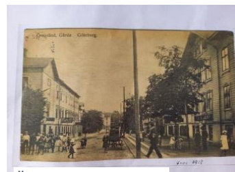
Örngränd foto 1918

Troligtvis bestod lägenheten av ett rum och kök. Med en familj bestående av elva personer måste det varit trångt.